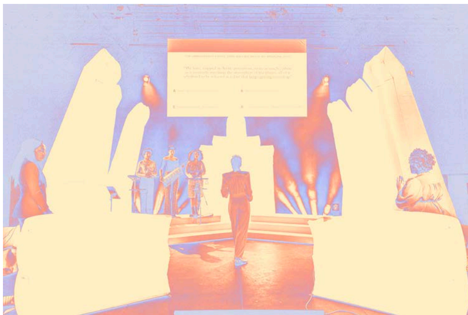
KillJoy Quiz, Luanda Casella · NTGent

Van 19 tot 24 september 2022 in Brussel.