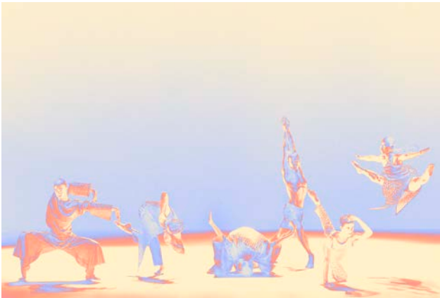
Deep Time, Virpi Pahkinen Dance Company

FAME is een jaarlijks multidisciplinair podiumkunstenfestival voor het grote publiek. Dit feestelijke en culturele evenement wil kunst en feminisme samenbrengen door middel van optredens gemaakt door hoofdzakelijk vrouwelijke kunstenaars en kunstenaars die tot een genderminderheid behoren.