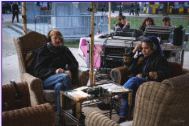
Vulcana © Samy Soussi

De tijd nemen om na te denken, om de dingen uit te diepen, om diepgaand werk te leveren, om een reflectie na te streven. Denken houdt ook het kiezen in, het innemen van standpunten. Denken is soms ook falen in het denken, fouten maken, deze erkennen, zich verbeteren.