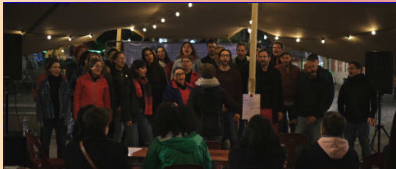
Sing Out Brussels

het Bellone het Broodhuis het Cinematek het C12 het cultureel centrum Hageltoren de KVS het Mode en Kant Museum het Montagne Magique theater het Riches-Claire theater