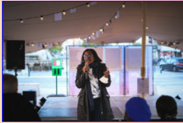
Comité des Femmes sans Papier

Verstoren zoals het opheffen van grenzen tussen instellingen en de marge, tussen disciplines, tussen genres, tussen mensen, tussen wat reeds erkend is en hetgeen dat nog niet erkend is, het verstoren van ieders positie en functie. ideas about spaces, functions and routines.