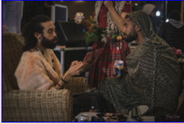
So Sucks - QRE.w

Zorg dragen voor de ander, voor anderen, voor je collega's, maar ook voor de artiesten en het publiek. Zorg dragen voor het opgeleverde werk, zorg dragen voor de tijd, het naar waarde schatten van kwaliteit boven snelheid. Zorg dragen door potentieel geweld te identificeren en mechanismen in te stellen om deze te voorkomen en aan te pakken als het zich voordoet. Ook het zorgen voor onze omgeving, ons ecosysteem, door onze praktijken en organisatie ecologisch te maken.