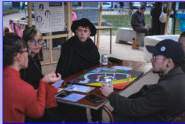
Vulcana © Samy Soussi