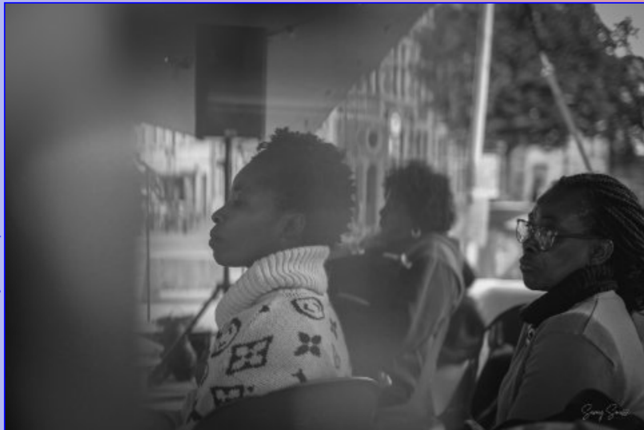
Comité des Femmes Sans Papier

Om dit wijds thema “Erfenissen en Transmissie-s” te verkennen, hebben we vijf sporen gekozen: